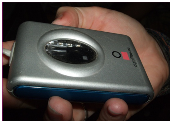
Lector de huella digital, Centro de Salud Sócrates Flores Rivas, Nicaragua, 2009.

Fuentes: 1. Blaya JA, Fraser HS, Holt B. E-health technologies show promise in developing countries. Health Aff (Millwood) . 2010;29(2):244-51. [Título: Tecnologías de eSalud resultan prometedoras para países en desarrollo]